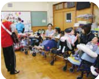
さあ、授業を始めるよ!

草津養護学校では、本人の体調が不安定であることや通学の困難さから、教師が自宅に訪問して授業を受けている生徒もいます。(訪問教育)