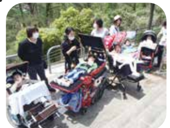
散歩や校外学習にも行くよ。