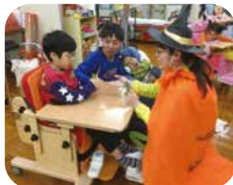
先生が魔女に!? わくわくドキドキ!