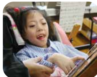
楽器に触れて響きを体感!